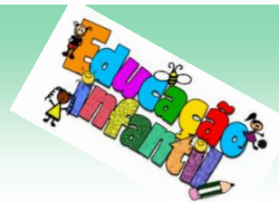
ILUSTRAÇÃO: VANESSA ALEXANDRE