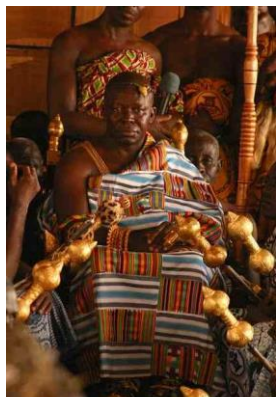
Asantehene Osei Tutu II vestindo uma roupa Kente, 2005

Kente é um tipo de tecelagem que foi muito utilizado nas mais belas vestimentas de realeza Asante (etnia de um dos povos que vivem no país de Gana). Hoje em dia, o Kente tornou-se mais acessível, no entanto, ainda assim é visto como símbolo de riqueza, status social elevado e sofisticação cultural.