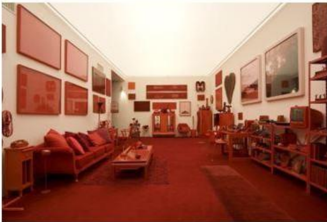
Cildo Meireles- Obra Conceitual: Desvio para o Vermelho

Na aula anterior aprendemos o conceito de Monocromia e as possibilidades de uso nos diversos campos das Artes. Hoje apresento a vocês o trabalho do artista Cildo Meireles e a sua obra denominada: Desvio para o vermelho.