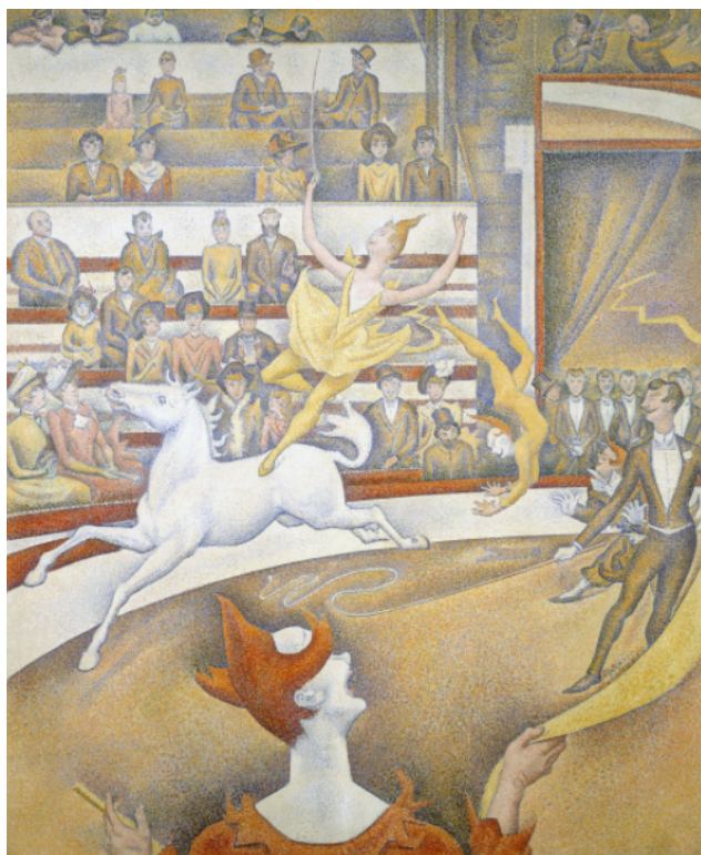
“O circo”, de Georges Seurat, pintura de 1891

Compartilhe seu cartaz com sua turma no grupo do WhatsApp da escola! Boa semana!