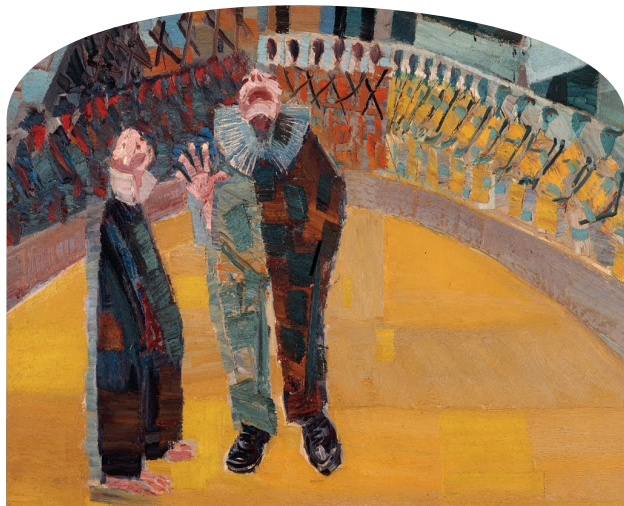
Detalhe de “Circo”, pintura de Candido Portinari (1957)