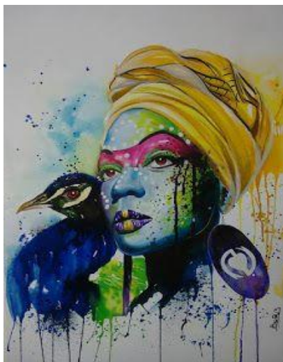
Figura 5- Sem título , de Adelson Boris