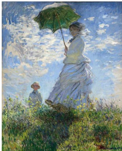
Figura 2- Camille e Jean na Colina , de Claude Monet