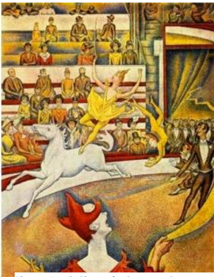
Figura 1 – O Circo, de Georges Seura