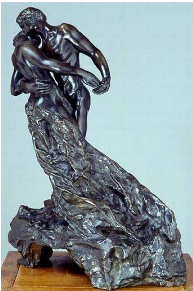
"Valsa" de Camille Claudel

Lembra quando conversamos sobre escultura? Vamos fazer uma escultura? Precisaremos também recordar a diferença entre um plano bidimensional (trabalha sobre superfícies que contenham altura e comprimento) e o tridimensional (explora a altura, o comprimento e a largura). Dessa forma, uma escultura terá volume e profundidade concretos. Ela ocupará o espaço em três dimensões, sendo possível observar a escultura de vários pontos de vista, diferente do desenho ou da pintura que nos exige olhar pelo ponto de vista estabelecido. Observe os exemplos abaixo: