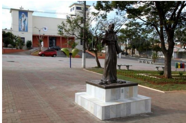
Escultura Praça Vila Real – Hortolândia-SP

Prefeitura Municipal de Hortolândia SECRETARIA DE EDUCAÇÃO, CIÊNCIA E TECNOLOGIA