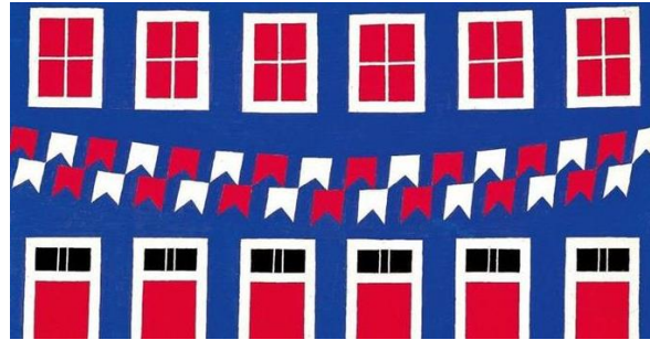
Obra: Fachada Festiva 'Alfredo Volpi

Lembrando que releitura é se inspirar na obra do artista, usando a sua criatividade e transformando em algo novo.