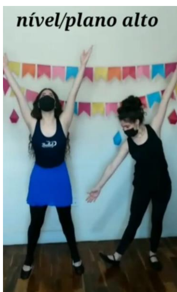
1 Nível alto: em pé ou uma pose que você consiga ficar bem alto

Agora vamos vivenciar esses elementos na brincadeira chamada “ Estátua ”.