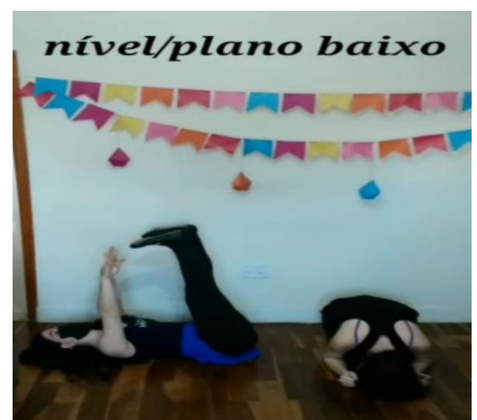
3 Nível baixo: no chão

Então, vamos lá! Toda vez que a música parar, você vai realizar as três poses que você escolheu sem parar, ou seja, você vai fazer toda a sequência e depois congelar/ ESTÁTUA .