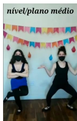
2 Nível médio: de maneira que seus joelhos fiquem levemente dobrados