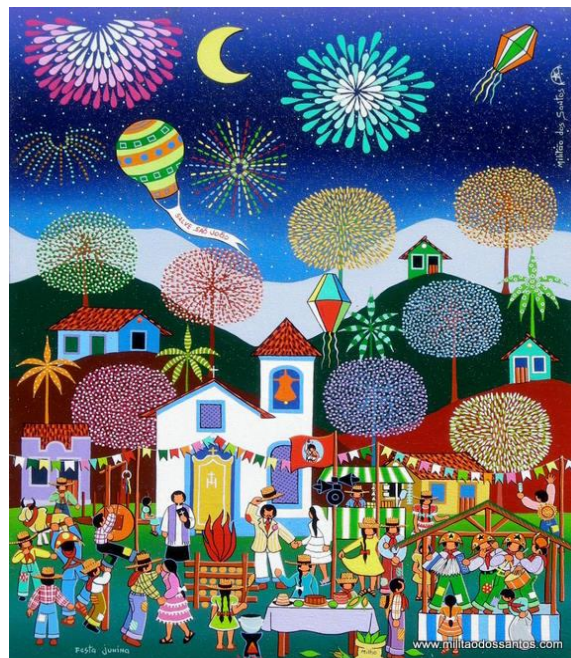
Pintura de Militão dos Santos