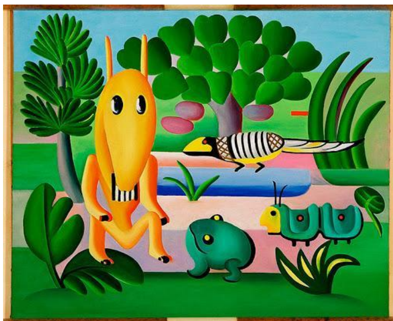
A Cuca, 1924. Tarsila do Amaral. Óleo sobre tela, 73 x 100 cm. Museu de Grenoble, França.

Abaixo algumas pinturas que foram inspiradas em dois personagens folclóricos brasileiros.