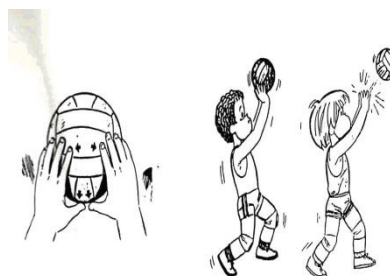
Figura 2: posição das mãos e o corpo