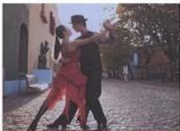
Dançarinos de tango 2016. Dança tradicional Argentina e Uruguai, hoje conhecida no mundo inteiro. O tango passou a integrar a lista de Patrimônios Imateriais da Humanidade em 2009.