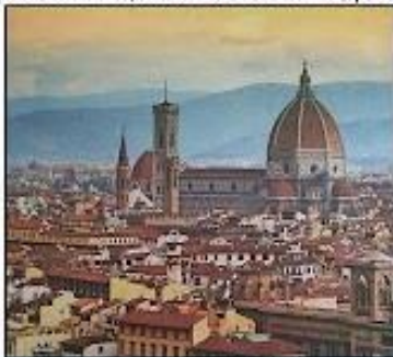
Vista da cidade de Florença na Itália, cujo Centro Histórico foi considerado, em 1980, Patrimônio Material da Humanidade.

Patrimônio natural: compreende áreas de importância preservacionista e histórica, beleza cênica, enfim, áreas que transmitem à população a importância do ambiente natural para que nos lembremos quem somos, o que fazemos, de onde viemos e, por consequência, como seremos.