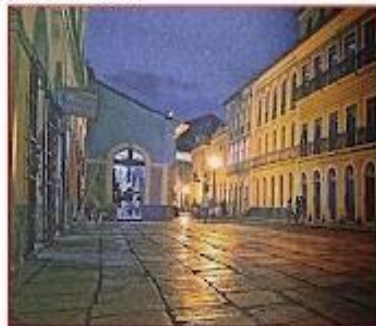
Centro histórico de São Luís é Patrimônio Material da Humanidade. MA, 2006.