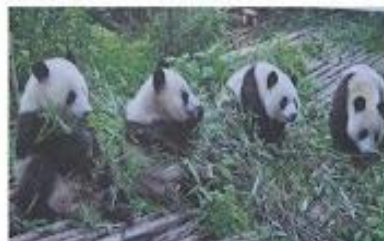
Reserva natural dos pandas-gigantes em Sichuan, China. Em 2006, a reserva passou a integrar a lista dos Patrimônios da Humanidade.