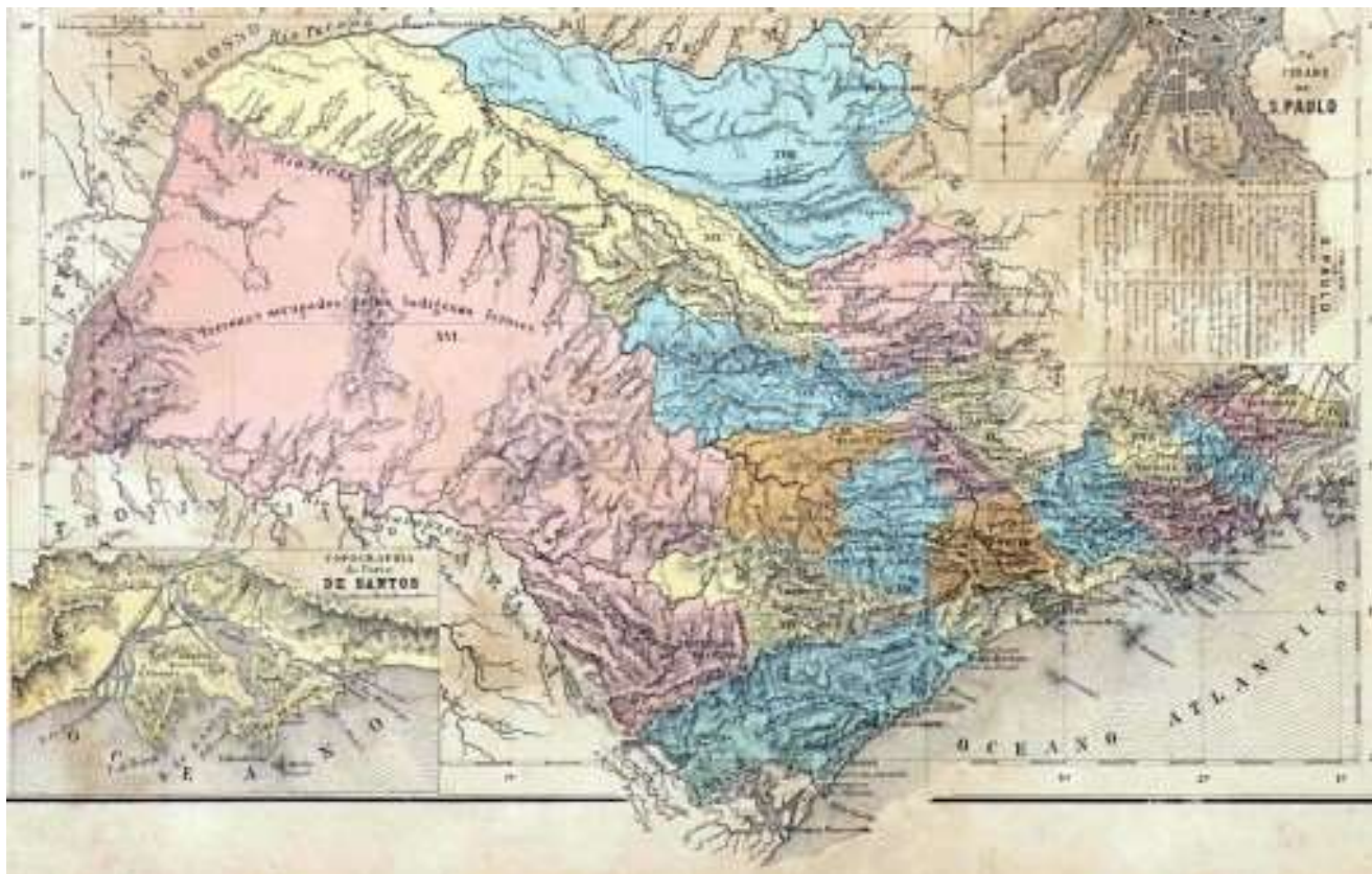
Figura 1: Cândido Mendes, Província de São Paulo, Atlas do Império do Brasil, 1868.

Como vimos o estado de São Paulo surgiu como uma província. Vamos conhecer algumas de suas representações cartográficas: