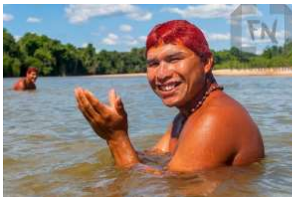
INDÍGENAS TOMANDO BANHO NO RIO

14 – COMPARE AS ATIVIDADES QUE VOCÊ OBSERVOU ACIMA COM AS QUE VOCÊ E SUA FAMÍLIA REALIZAM NA SUA CASA E COMPLETE AS FRASES: