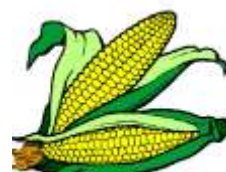
2 ESPIGAS DE MILHO

A) QUANTAS MANDIOCAS ELES PRECISARÃO TROCAR PARA CONSEGUIR 14 ESPIGAS DE MILHO? DESENHE PARA RESOLVER.