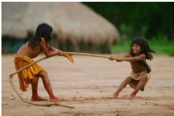
CRIANÇAS INDÍGENAS BRINCANDO

13 - OBSERVE AS IMAGENS ABAIXO E LEIA AS LEGENDAS: