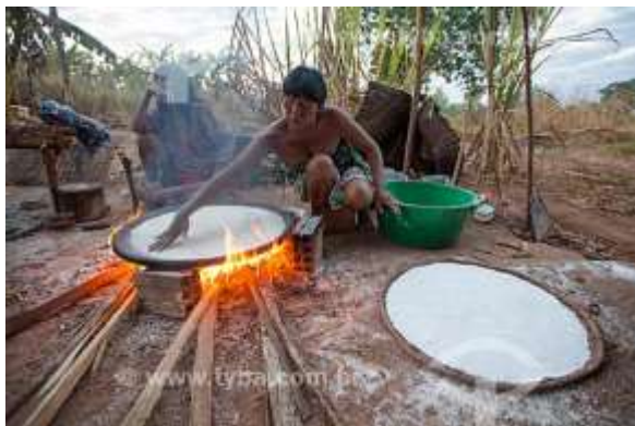
MULHER INDÍGENA COZINHANDO