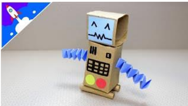
Imagem disponível: https://i.ytimg.com/vi/ug_HnGFy5qs/mqdefault.jpg

VOCÊ VAI PRECISAR DE DOIS ROLOS DE PAPEL HIGIÊNICO, COLA BRANCA, CANETINHA, FOLHA DE SULFITE (PARA DESENHAR A BOCA, OLHOS E FAZER OS BRAÇOS DO ROBÔ).