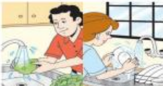
Lavar as verduras, frutas, cozinhar