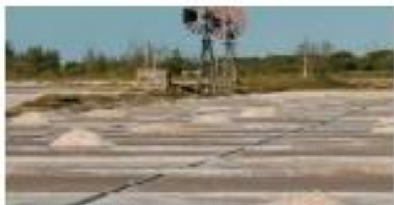
Salina: local onde o sal é retirado da água do mar.

A maior parte da água existente na Terra salgada e faz parte dos mares e oceanos. O sal que utilizamos para temperar as refeições é retirado da água do mar.