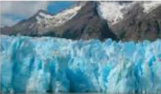
A maior parte da água doce está nas geleiras.

A água de rios, lagos e fontes é denominada doce, pois apresenta pouco sal e não tem sabor salgado.