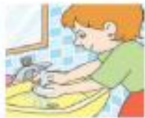
Lavar as mãos e tomar banho.