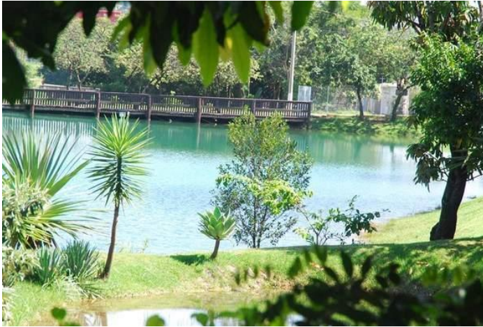
Parque Socioambiental Irmã Dorothy Stang - Hortolândia

De trilha, passagem para tropeiros Nascestes em caminhos do vento No planalto paulista, a Vila, a Estação Hoje indústrias e ontem fazendas! Sim ao florescer em ti o sentimento De ter uma vida melhor Oh! Cidade querida, tu és a nossa vida