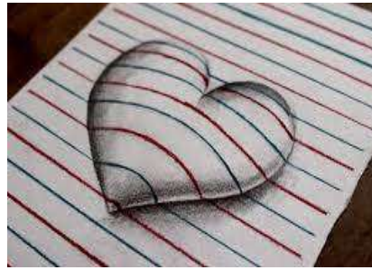
FIGURA COM VOLUME