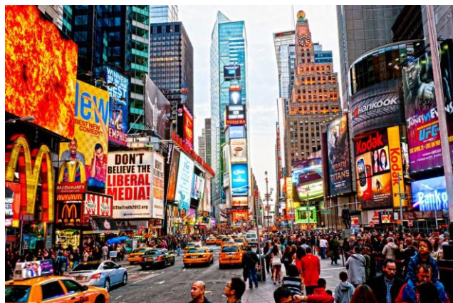
PAISAGEM URBANA: TIMES SQUARE, NOVA YORK, ESTADOS UNIDOS