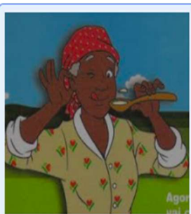
Receitas da Tia Nastácia: Delícia: Bi... receitasnastacia.blogspot.com

Leitura diária: Menina bonita do laço de fita. Disponível em: https://youtu.be/XU23FT3vPZM