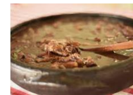
FEIJOADA CULINÁRIA AFRICANA