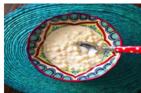
CANJICA CULINÁRIA INDÍGENA