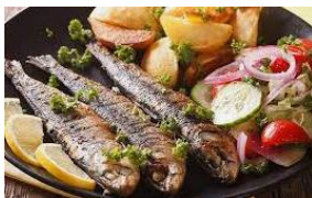
SARDINHA CULINÁRIA POTUGUESA

DIVERSOS GRUPOS POPULACIONAIS E ÉTNICOS SE JUNTARAM NA FORMAÇÃO DE NOSSA POPULAÇÃO E NOSSAS CIDADES, POR ISSO TEMOS UMA DIVERSIDADE MUITO RICA EM NOSSA CULTURA QUE PODE SER EXEMPLIFICADA PELA CULINÁRIA TÍPICA DESTES DIVERSOS GRUPOS.