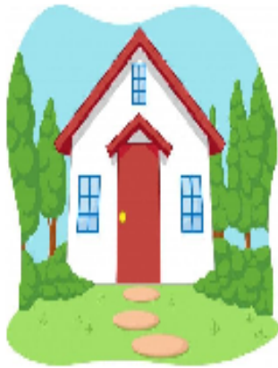
CASA DE EURICO

DESAFIO: ESSE É O EURICO ELE NÃO GOSTA DE OBJETOS OU SITUAÇÕES QUE PROPAGAM O SOM. ELE PRECISA CHEGAR A CASA DELE, LÁ É PROTEGIDA DO BARULHO EXTERNO. VOCÊ PODE AJUDÁ-LO LEVANDO-O POR UM CAMINHO SILÊNCIOSO? FEITO ISSO ESCREVA O NOME DOS QUATRO OBJETOS QUE ESTÃO NO LABIRINTO QUE EMITEM SOM.