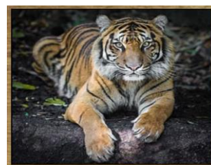
TIGRE 105 DIAS