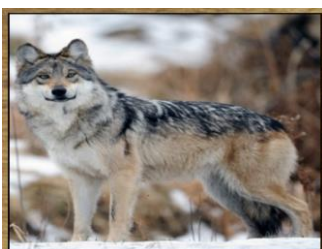
LOBO 63 DIAS