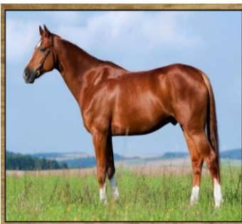
CAVALO 330 DIAS