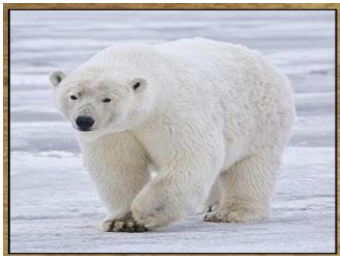
URSO POLAR 240 DIAS