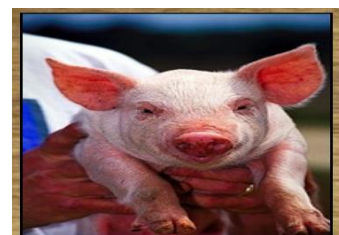
PORCO 112 DIAS

AGORA, CIRCULE O ANIMAL QUE APRESENTA O MAIOR PERÍODO DE GESTAÇÃO.