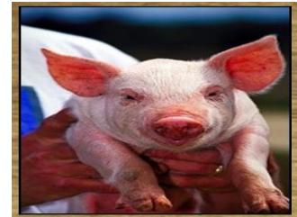
PORCO 112 DIAS