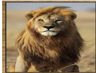
LEÃO 30 DIAS