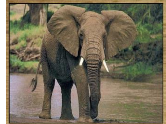
ELEFANTE 624 DIAS