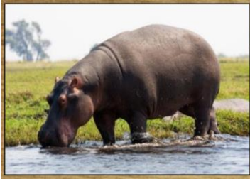
HIPOPÓTAMO 240 DIAS

ALGUNS ANIMAIS NASCEM DE OVOS . O PERÍODO QUE ELES PASSAM CRESCENDO DENTRO DOS OVOS É CHAMADO DE INCUBAÇÃO . OUTROS ANIMAIS CRESCEM DENTRO DA BARRIGA DA MÃE . ESSE PERÍODO É DENOMINADO GESTAÇÃO , QUE VARIA DE ESPÉCIE PARA ESPÉCIE. VEJA: