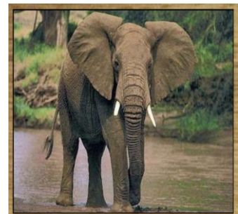
ELEFANTE 624 DIAS