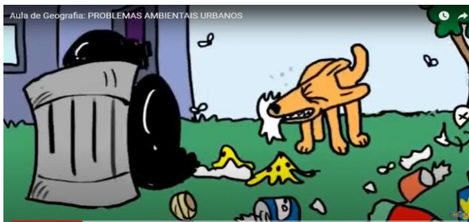
IMAGEM EXTRAÍDA DO VÍDEO PROBLEMAS AMBIENTAIS. DISPONÍVEL EM: https://youtu.be/dE7WUfKQgp8 ACESSO EM 24/08/2021