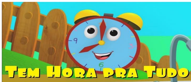
IMAGEM EXTRAÍDA DO VÍDEO DA LEITURA. DISPONÍVEL EM: ACESSO EM: 28/08/2021

(24) A Turma do Seu Lobato - Tem Hora Pra Tudo (Vol 2 - Música Infantil) - YouTube