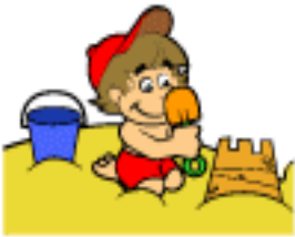
Castelo de areia