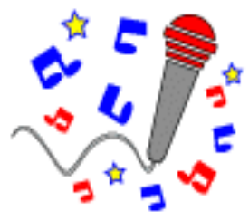
Cantar uma música