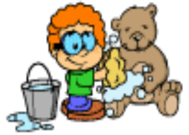
Lavar o ursinho