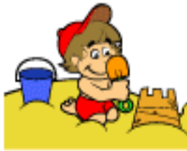
Castelo de areia