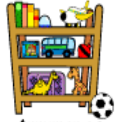
Arrumar os brinquedos