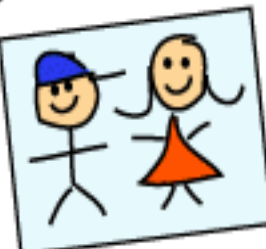
Fazer um desenho