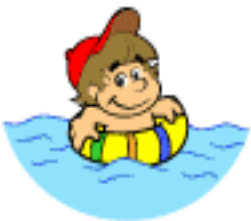
Nadar na piscina