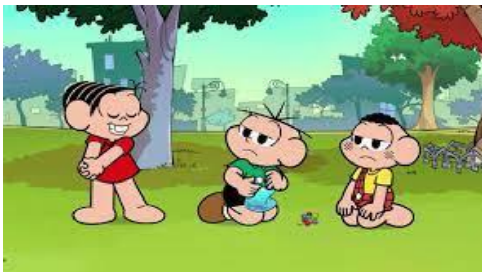
IMAGEM EXTRAÍDA DO VÍDEO DA LEITURA. DISPONÍVEL EM: https://www.youtube.com/watch?v=mjh7JYFpiHc . ACESSO EM 24/09/2021.

https://www.youtube.com/watch?v=mjh7JYFpiHc