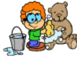
Lavar o ursinho