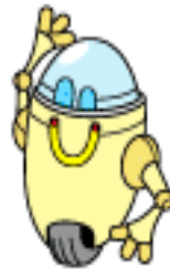
Fazer um robô