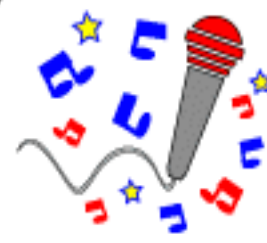
Cantar uma música