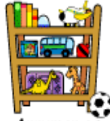
Arrumar os brinquedos