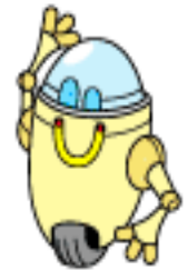
Fazer um robô