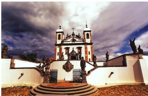
Santuário de Bom Jesus de Matosinhos, Congonhas do Campo (Minas Gerais)

A UNESCO (Organização das Nações Unidas para a Educação, a Ciência e a Cultura) possui uma lista de Patrimônios da Humanidade. Atualmente existem 13 Patrimônios Históricos e Culturais da UNESCO no Brasil. Seis deles são na região centro-oeste, sendo quatro somente em Minas Gerais. Veja as fotos: