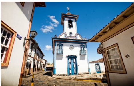
Centro Histórico de Diamantina (Minas Gerais)