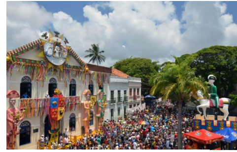
Centro Histórico de Olinda (Pernambuco)