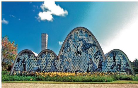
Pampulha, Belo Horizonte (Minas Gerais)