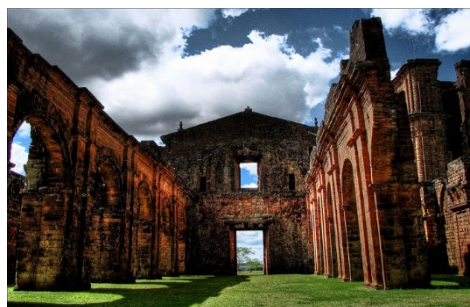
Ruínas de São Miguel das Missões (Rio Grande do Sul)