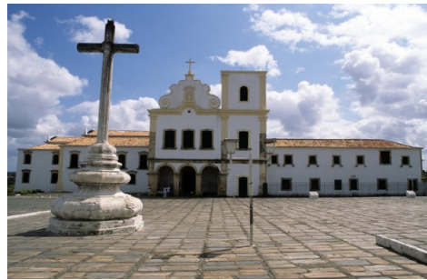
Praça São Francisco, São Cristóvão (Sergipe)