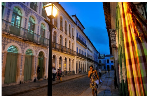
Centro Histórico de São Luís (Maranhão)