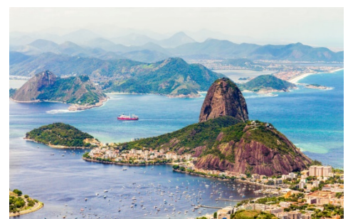
Paisagens Cariocas, Rio de Janeiro (Rio de Janeiro)