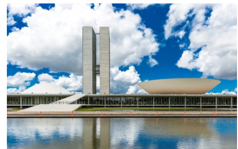
Brasília (Distrito Federal)