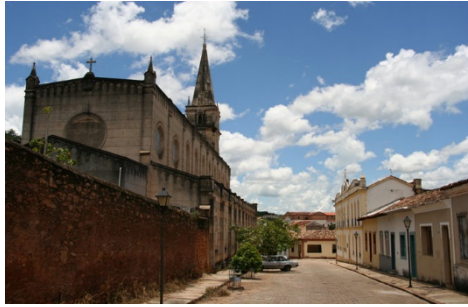
Centro Histórico da Cidade de Goiás (Goiás)