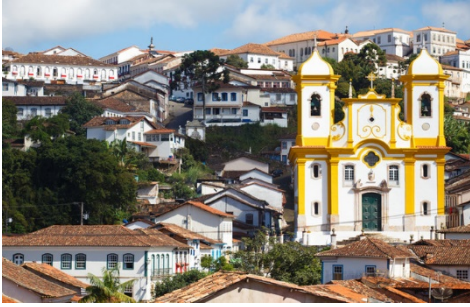
Centro Histórico de Ouro Preto (Minas Gerais)