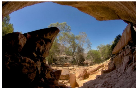
Parque Nacional Serra da Capivara (Piauí)