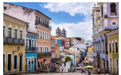
Centro Histórico de Salvador (Bahia)