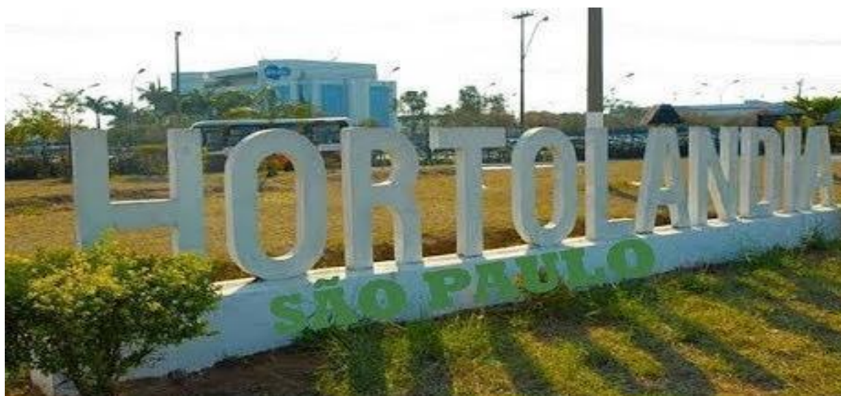
IMAGEM: https://youtu.be/sgpSYQPnMgs?t=21 - ACESSO EM: 19 ABR 2021.

NO DIA 19 DE MAIO DE 2021 HORTOLÂNDIA FARÁ 30 ANOS. ASSISTA AO VÍDEO ABAIXO JUNTAMENTE COM SUA FAMÍLIA, CONVERSE SOBRE A SUA CIDADE E O QUE VOCÊ MAIS GOSTA NELA. DISPONÍVEL EM: https://www.youtube.com/watch?v=sgpSYQPnMgs - ACESSO EM: 19 ABR. 2021.