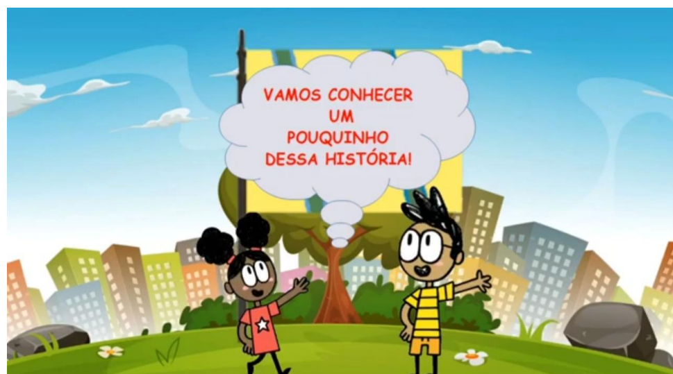
IMAGEM: https://www.youtube.com/watch?v=eoCulVy0m2A – ACESSO EM: 05 MAI. 2021.

DISPONÍVEL EM: https://www.youtube.com/watch?v=eoCulVy0m2A – ACESSO EM: 05 MAI. 2021.