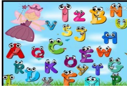
IMAGEM: https://www.youtube.com/watch?v=kdtYfAnS6fg - ACESSO EM: 3 MAI. 2021.

DISPONÍVEL EM: https://www.youtube.com/watch?v=kdtYfAnS6fg - ACESSO EM: 3 MAI. 2021.