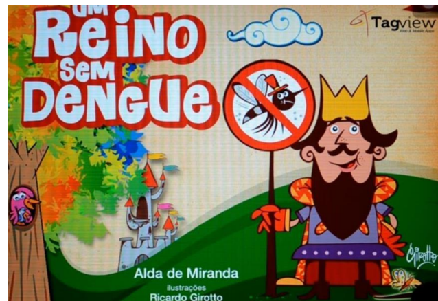
IMAGEM: https://www.youtube.com/watch?v=4ilBUaYYjvl – ACESSO EM: 3 MAI. 2021

DISPONÍVEL EM: https://www.youtube.com/watch?v=4ilBUaYYjvl ACESSO EM: 3 MAI. 2021