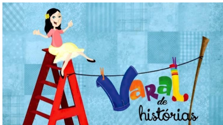
IMAGEM: https://www.youtube.com/watch?v=qZzqycNZQHo – ACESSO EM: 3 MAI.2021

DISPONÍVEL EM: https://www.youtube.com/watch?v=qZzqycNZQHo - ACESSO EM: 3 MAI. 2021.