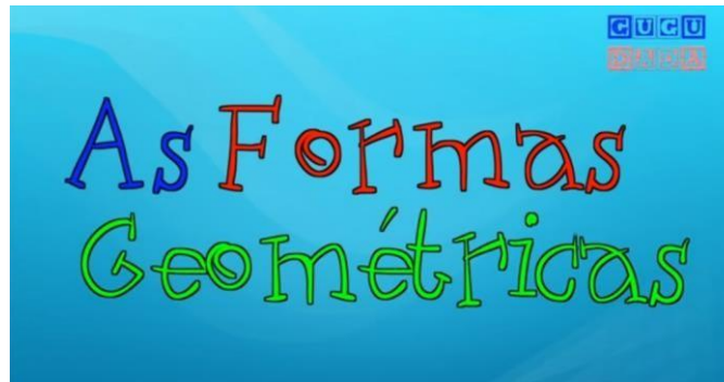
IMAGEM: https://www.youtube.com/watch?v=0kijR9Q2rwE – ACESSO EM: 3 MAI. 2021

DISPONÍVEL EM: https://www.youtube.com/watch?v=0kijR9Q2rwE ACESSO EM: 3 MAI. 2021