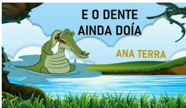
IMAGEM: https://www.youtube.com/watch?v=vSUdcbG_uVY – ACESSO EM: 3 MAI. 2021

DISPONÍVEL EM: https://www.youtube.com/watch?v=vSUdcbG_uVY - ACESSO EM: 3 MAI. 2021