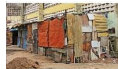
Barracos improvisados, município de Fortaleza, estado do Ceará, 2015.