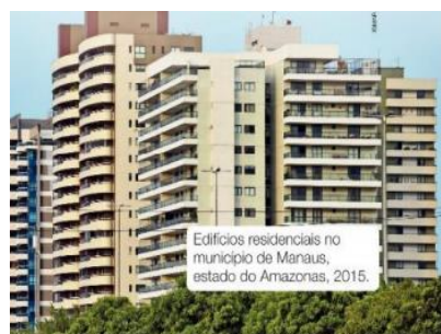
Edifícios residenciais no município de Manaus, estado do Amazonas, 2015.