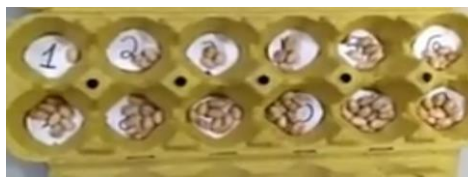
ACERVO DA PROFESSORA.

LEMBRE-SE DE ESCREVER SEU NOME E A DATA. # LEMBRE-SE DE ENVIAR UMA FOTO PARA SUA PROFESSORA.