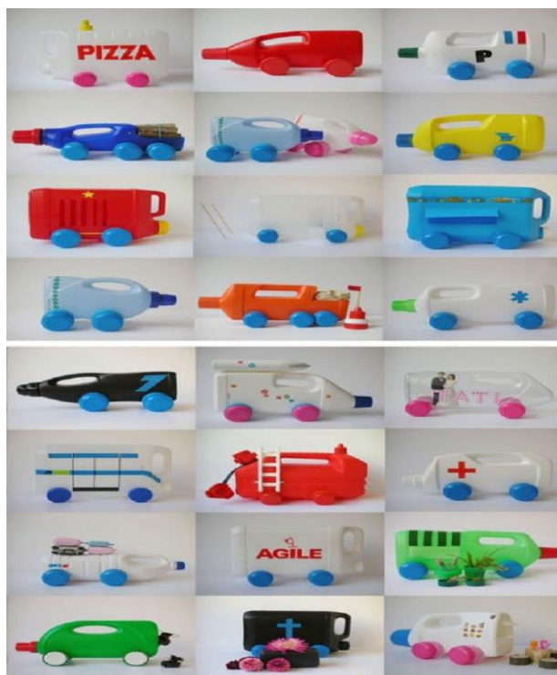
IMAGEM: https://www.revistaartesanato.com.br/brinquedos-com-material-reciclado/ - ACESSO EM: 22 MAI. 2021.

# LEMBRE-SE DE ENVIAR UMA FOTO PARA SUA PROFESSORA.