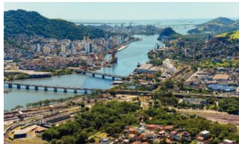
Paisagem no município de Vitória, estado do Espírito Santo, em 2016.