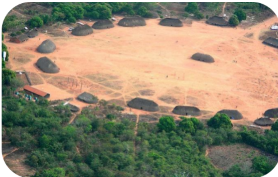
Ocara Ipatse no Parque Nacional do Xingu.

Faça com capricho, e divirta-se! Tire fotos do cenário indígena que você confeccionou com as ocas e materiais da natureza. Envie o registro a/o professor/a de Arte.