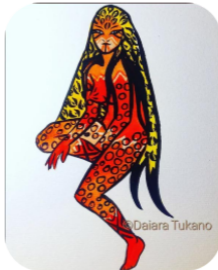
Ilustração de Daiara Tukano

A cultura indígena é muito rica e diversa. Você sabe como são as habitações indígenas? Existem várias formas de construir as moradias/casas indígenas, variando de cada etnia. Vamos estudar um pouco mais sobre!