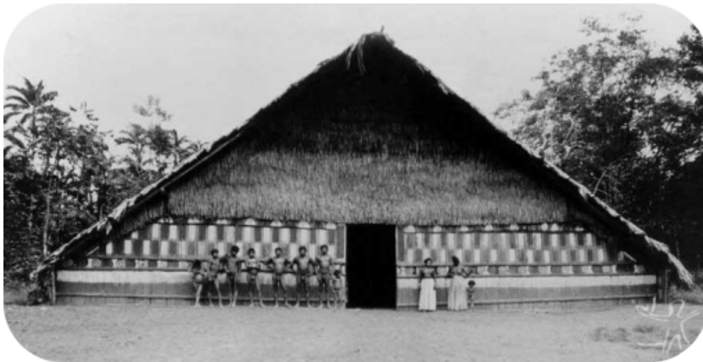
Fotografia de uma maloca da etnia Tukano

Então dobre um papel sulfite, ou outro qualquer para montar o cenário de uma tribo indígena com esses materiais recolhidos. Complete com desenhos de outros elementos (rio, árvores, animais, aldeia, oca, peixes, céu, mata, cachoeira, pedras) e depois termine colorindo-os.