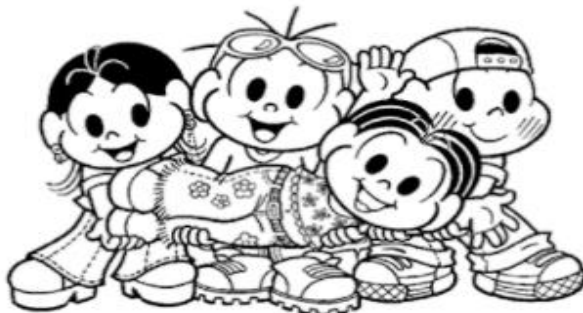
CALENDÁRIO OUTUBRO - 2021

4-) PINTE NO CALENDÁRIO OS DIAS DOS SÁBADOS E DOMINGOS DE VERMELHO.