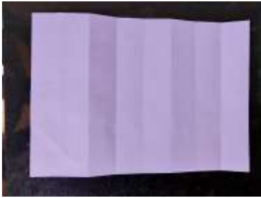
(1) folha aberta

Usando uma folha de papel, dobre três vezes na metade, como mostram as figuras: