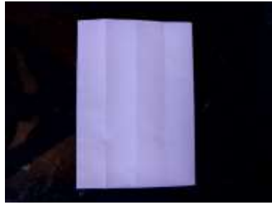
(2) primeira dobra