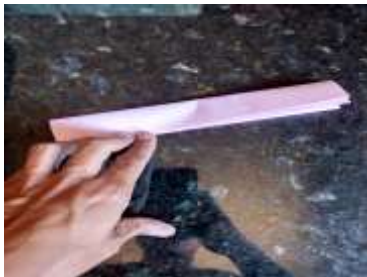
(4) terceira dobra

(5) Abra a folha outra vez e agora dobre na forma de sanfona