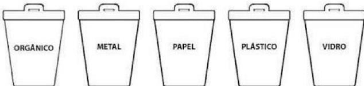
IMAGEM: PROJETO AKATU.

AGORA, PINTE AS LIXEIRAS NAS CORES CORRESPONDENTES.