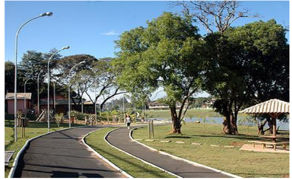
Parque Santa Clara (CREAPE)