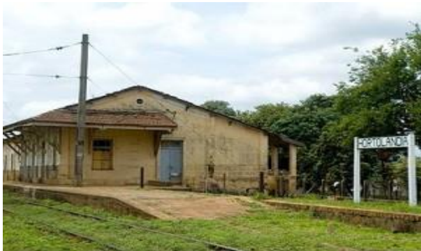
Antiga Estação Ferroviária de Hortolândia, na Vila Real, onde será implantado o Centro de Memória.