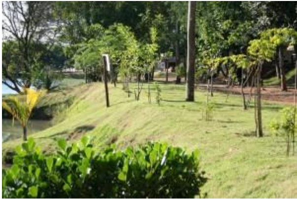
Parque Socioambiental Dorothy Stang