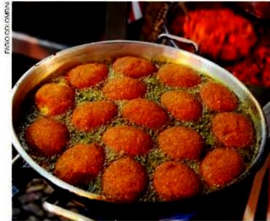
O acarajé, bolinho de feijão frito em azeite de dendê, é uma herança da cultura africana.

Pratos como o vatapá e o acarajé e o hábito de consumir azeite de dendê são alguns exemplos da influência africana na culinária brasileira.