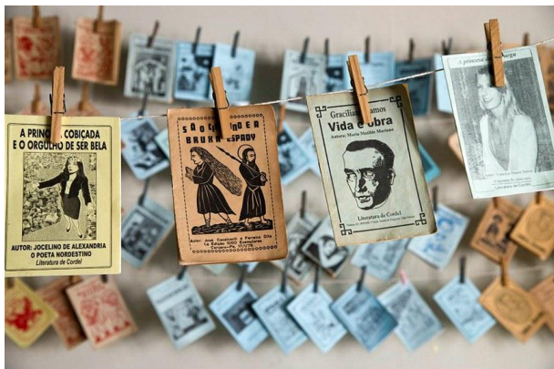
LITERATURA DE CORDEL