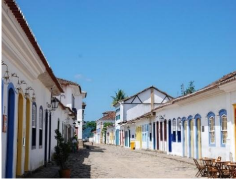
PARATI NO RIO DE JANEIRO

1) COM BASE NA LEITURA DO TEXTO EM SEU CADERNO DE HISTÓRIA, CLASSIFIQUE OS PATRIMÔNIOS EM NATURAL (PN), PATRIMÔNIO MATERIAL (PM) E PATRIMÔNIO IMATERIAL (PI).