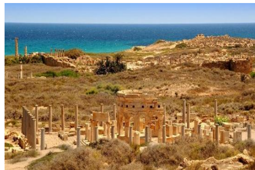
SÍTIO ARQUEOLÓGICO NA LÍBIA.