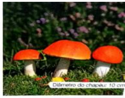
Cogumelos são fungos formados por várias células, ou seja, são pluricelulares. Diâmetro do chapéu: 10 cm.

AS VEZES PODEM SER CONFUNDIDOS COM PLANTAS POR NÃO SE LOCOMOVEREM, MAS NÃO PRODUZEM O PRÓPRIO ALIMENTO. A MAIORIA SE ALIMENTA DE RESTOS DE SERES VIVOS.