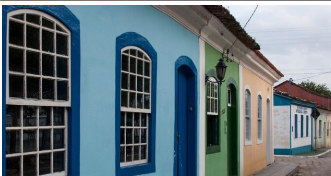
PORTUGAL: Arquitetura açoriana em Florianópolis

BIBLIOGRAFIA: Buriti Mais História, 4º Ano, p.121, 122, 123. Organizadora: Editora Moderna. Editora Responsável, Lucimara Regina de Souza Vasconcelos. 1ª edição, São Paulo 2017