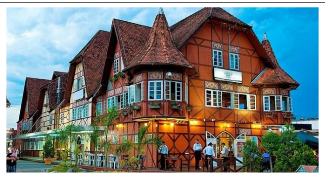
Influência alemã na arquitetura de Blumenau

https://www.todamateria.com.br/cultura-da-regiao-sul/ ACESSO 14.05.2021