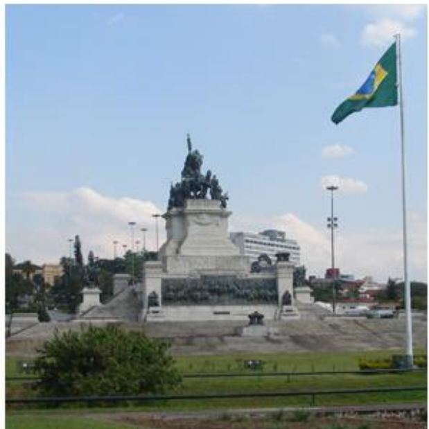
'Colina do Ipiranga', de Miguelzinho Dutra (esq), e o 'Monumento à Independência', suposto local onde ocorreu o grito (Foto: Reprodução/Museu Paulista e Paulo Toledo Piza/G1)