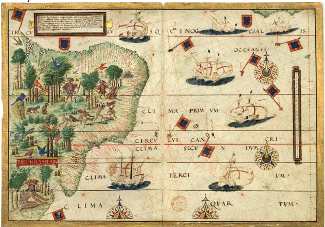
Foto: Lopo Homem, 1519, Atlas Náutico Português gallica.bnf.fr/Bibliothèque Nationale de France

Por isso, os portugueses resolveram colonizar o Brasil. Trouxeram muitas pessoas de Portugal e ensinaram os índios a falar o português através dos padres jesuítas.