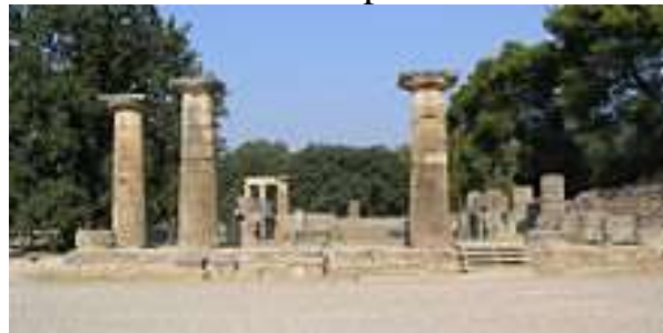
Ruínas do templo de Hera

A programação típica dos jogos da Antiguidade era assim: