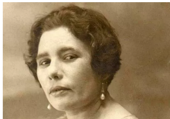
Fotografia de Celina Guimarães Viana (Foto: Reprodução)

https://www.google.com/url?sa=i&url=https%3A%2F%2Frevista.galileu.globo.com%2Fsociedade%2Fhistoria%2Fnoticia%2F2018%2F08%2Festa-foi-primeira-mulher-se-registrar-como-eleitor-no-brasil.html&psig=AQvVaw1IM44S8IPNcCRfEdYpbZwb&ust=1633293046082000&source=images&cd=vfe&ved=0CAwOjhXqGAoTCNcatTirPMCFQAAAAAdAAAAABDMag