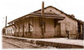
Estação Jacuba (Estação antiga de Hortolândia)

Vilarejo de Jacuba dá origem a Hortolândia