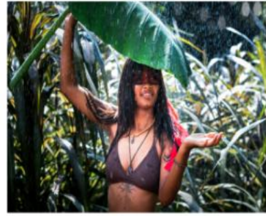
Ric rodríguez / Pixels