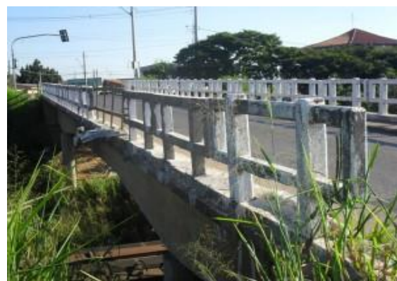
FOTOS ANTIGAS DE RUAS DO JARDIM NOVO ÂNGULO