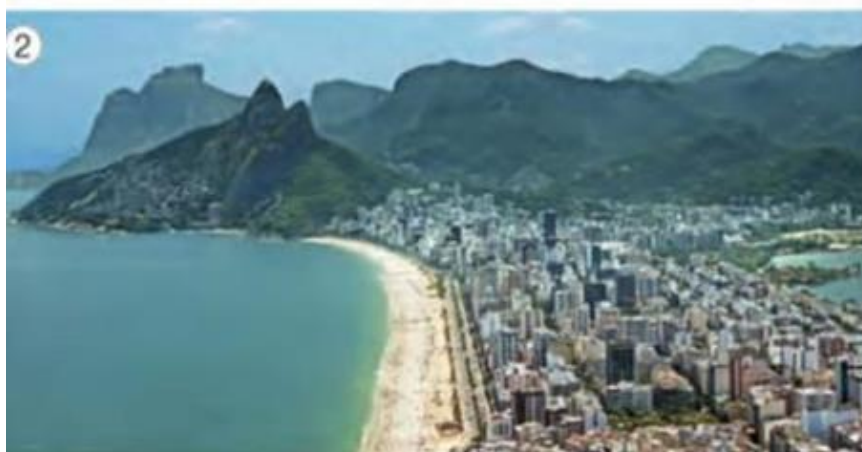
VISTA DO BAIRRO DE IPANEMA, NA CIDADE DO RIO DE JANEIRO, EM 2014.

EDITORA MODERNA (ORG.); JOMAA, L. Y. (Editora responsável). Buriti Mais Geografia, 2 ano ensino fundamental, anos iniciais (manual do professor) . 1 ed. São Paulo: Moderna, 2017 página 14