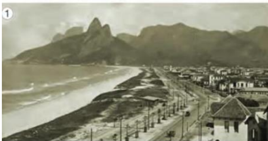
VISTA DO BAIRRO DE IPANEMA, NA CIDADE DO RIO DE JANEIRO, EM 1911.

OBSERVE AS IMAGENS ABAIXO PARA ENTENDER MELHOR AS MUDANÇAS DE UM BAIRRO: