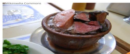
FEIJOADA REGIÃO SUDESTE

a-Faça uma lista de alimentos que você conhece e que NÃO são de origem da cidade de Hortolândia/SP.