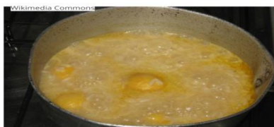
ARROZ COM PEQUI REGIÃO CENTRO - OESTE