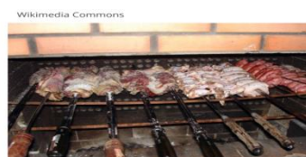
CHURRASCO - REGIÃO SUL