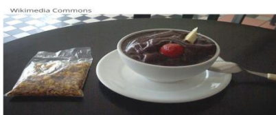
AÇAI - REGIÃO NORTE

2-Os movimentos migratórios - pessoas que vão e que vem formaram culinária da região sudeste, a feijoada do Rio de Janeiro é o estado de origem do prato brasileiro mais conhecido do Brasil no mundo. A tão conhecida e apreciada feijoada é uma iguaria carioca. Pizza em São Paulo é a segunda cidade no mundo que mais consome pizza e, por isso, tem ótimas pizzarias. Queijo de minas acompanhado com goiabada em Minas Gerais, são muito apreciados a nível nacional o queijo de minas, o pão de queijo e também o doce de leite.