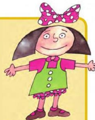
Serafina, personagem da literatura infantojuvenil.

O trecho retirado do livro faz parte do diário de um garoto que trabalha como entregador de pão durante a madrugada. O texto desse diário foi escrito por Serafina em um momento em que imaginava como deveria ser um dia na vida daquele menino.